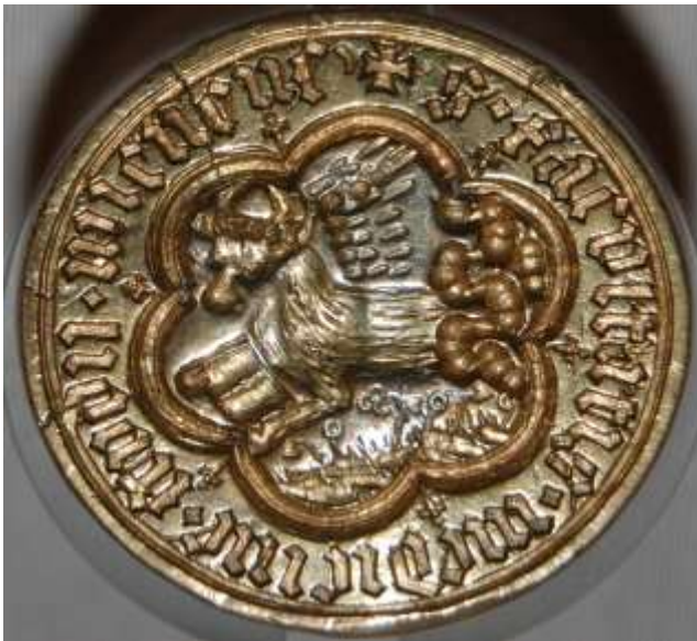
Abb. 1: Original des Siegeltypar der Medizinischen Fakultät der Universität Wien aus dem Jahr 1408 (Archiv der Universität Wien: AT-UAW, 126), Foto: © Martin G. Enne

Von Johannes Seidl, Martin G. Enne, Elisabeth Tuisl (†)